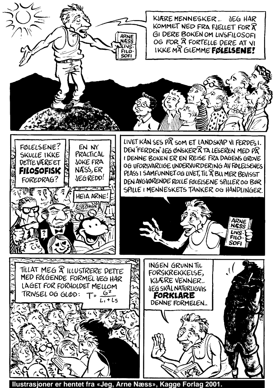
Illustrasjoner er hentet fra «Jeg, Arne Næss», Kage Forlag 2001.

– Økonomene må ta opp igjen det vidsynet som Adam Smith og hans samtidige la til grunn når det gjelder velværet i samfunnet. Du som økonom må være trenet i å samtale om alle vesentlige sosiale og psykologiske spørsmål, og ikke si: «Som økonom kan jeg ikke uttale meg her.» Dere må uttale dere på en måte som tilsvarer økonomiens betydning i samfunnet, og den er uhyggelig stor. Økonomifaget må bli mer orientert mot dagliglivets økonomi, hva vi trenger og hva vi ikke trenger, alt det vi ikke trenger, behovstilfredsstillelse og livskvalitet: Behovstilfredsstillelse versus økonomisk status, livskvalitet versus økonomisk status. Vi trenger flere økonomisk utdannede som publiserer og taler offentlig om dette. De fleste økonomer er redde for å bli «tatt» hvis de uttaler seg om forhold utenfor det vi til vanlig