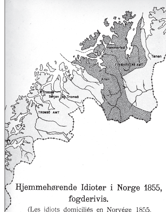
Hjemmehørende Idioter i Norge 1855, fogderivis.

Faksimile fra «De døvstumme i Norge. Bidrag til kjenskabet til døvstumhedens udbredelse, aarsager og sygdomsbillede tilligemed bemærkninger om dens forebyggelse og behandling af V. Uchermann, universitetsdocent. 2den del (Bilag)». Kristiania 1892.