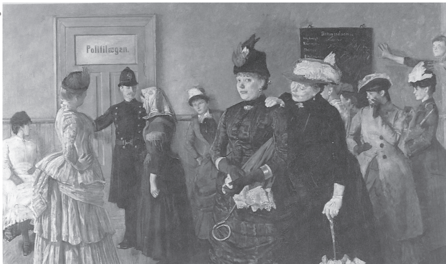
Bildet viser utsnitt av Christian Kroghs maleri "I Politilægens Venteværelse", malt 1886.

opptatt var han altså av å analysere eventuell sosial systematikk og samfunnsmessige årsaker til prostitusjonen: Var det slik at den fattige arbeiderklassens døtre ble tvunget ut i uføret av overklassens menn?