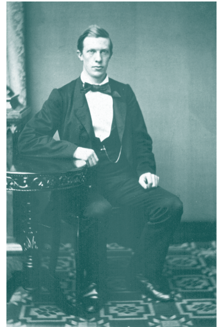
Anders Nicolai Kiær var Det Statistiske Centralbureaus første direktør (1876-1913).

Sedelighetstilstanden ble vanligvis målt ved antallet uekte fødsler. På samme måte som hos Eilert Sundt satte Kiær de illegitime fødslene i direkte forbindelse med samfunnets største sosiale problemer, fordi: "... de uægte børn ere udsatte for en større dødelighed end de ægte, at de gjenlevende af dem oftest kommer under uheldige livsvilkaar og ikke sjelden blive en byrde for det samfund, i hvilket de ere opvoxede." (Det Statistiske Centralbureau 1889, s. 197). Barn fødte av unge foreldre utenfor ekteskap var svært ofte fattige barn. Som hos Eilert Sundt var forholdet mellom usedeligheten og fattigdommen fremtredende i Kiærs moralstatistikk. Kiær hevder flere steder at dersom de arbeidende klasser levde edruelig og ordentlig med sin familie, levde de i grunnen ganske godt. Kiærs familieideologi kan tolkes som en tro på at dersom man bare fikk bukt med drukkenskapen og usedeligheten, ville sosial nød og fattigdom forsvinne. Denne analysen ligger ganske fjernt fra den revolusjonære arbeiderbevegelsen og samtidige fortolkninger av kapitalismens grunnleggende mekanismer.