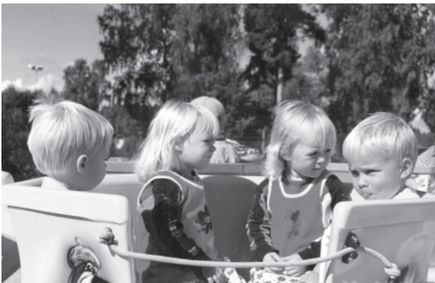
Vel 77 prosent av alle barn bodde med begge foreldre i 2000