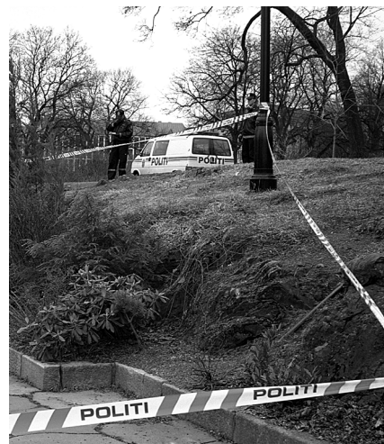
Graden av tillit til politiet, påtalemyndigheten og domstolene er avhengig av vår oppfatning av hva disse offentlige institusjonene virkelig gjør.

En påtalemessig beslutning vil i de fleste tilfeller innebære en henleggelse, et tilbud om å vedta et forelegg eller en tiltalebeslutning. Den påtalemessige avgjørelsen kan påklages av den fornærmede, og vil da bli gjenstand for en ny vurdering og eventuelt en ny påtalebeslutning. Når klagefristen er gått ut, eller en klage er ferdigbehandlet, vil den påtalemessige beslutningen - med mindre det er besluttet å ta ut tiltale - være den endelige avgjørelsen i straffesaken. I saker som omfatter grove seksualforbrytelser er det statsadvokatene eller riksadvokaten som har myndigheten til å foreta den endelige påtaleavgjørelsen. Når det tas ut tiltale er det ikke lenger påtalemyndigheten som beslutter hvilket endelig resultat det blir av straffeforfølgelsen, men domstolene.