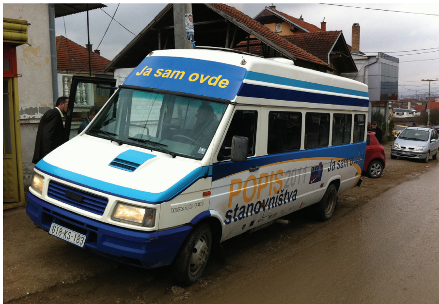
Egen buss for å skape blest om folketellingen i Kosovo: Ja Sam ovde – Jeg er her.

Forberedelsene til folketellingene i Makedonia, Albania og Serbia fortsetter, og disse landene vil trolig gjennomføre tellingene i oktober 2011. I Bosnia-Hercegovina gir den nåværende politiske situasjonen i landet lite håp om at det vil bli enighet om en folketellingslov i nær framtid. Dette medfører at Bosnia-Hercegovina blir et av få land i Europa som ikke gjennomfører en folketelling i 2011, noe som vil vanskeliggjøre landets videre integrasjon i Europa.