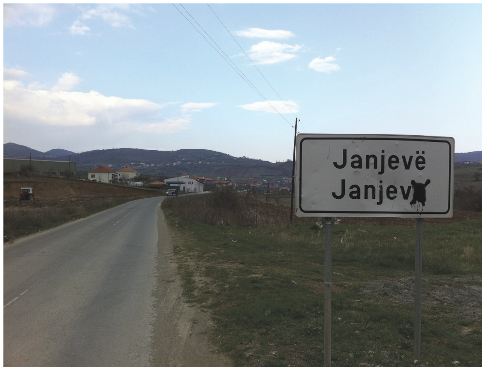
Janjeve (albansk) / Janjevo (serbisk/kroatisk). Før krigene på Balkan startet bodde mer enn 8 000 kroater i denne byen i Kosovo. I dag har de fleste flyttet, og bare et par hundre er tilbake.

Det er flere ulike måter å gjennomføre en folketelling på. I Norge og i Skandinavia har vi etter hvert bygget opp så gode administrative registre at vi ikke lenger har behov for å oppsøke befolkningen med spørreskjemaer for å få tak i folketellingsdata. Norge hadde sin siste tradisjonelle folketelling i 2001 (SSB 2011). Det eneste landet på Balkan som planlegger en tilsvarende registerløsning for 2011 er Slovenia, som har bygget opp et system bygd på skandinavisk modell.