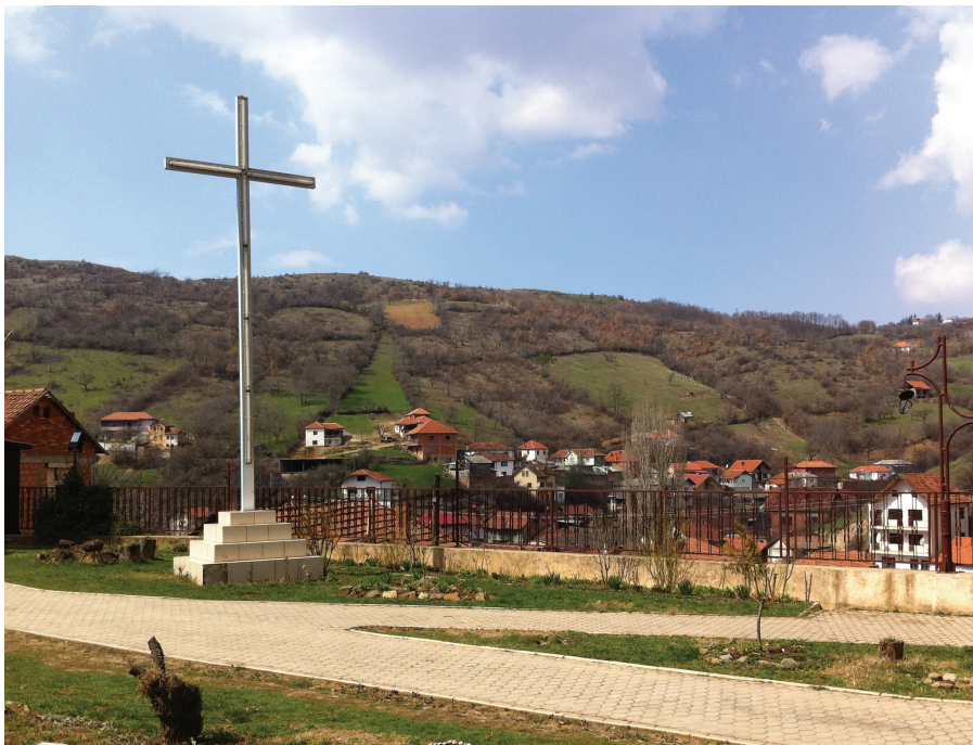
Spørsmålene om religion og etnisk tilhørighet er kontroversielle.

Et annet spørsmål som skaper mye hodebry for dem som planlegger folketellingene, er de internasjonale anbefalingene om hvor en person skal telles. Ifølge FN skal en person folketelles i det landet hvor hun/han har sitt faste bosted og har bodd de siste tolv månedene, eller har til hensikt å bo de neste