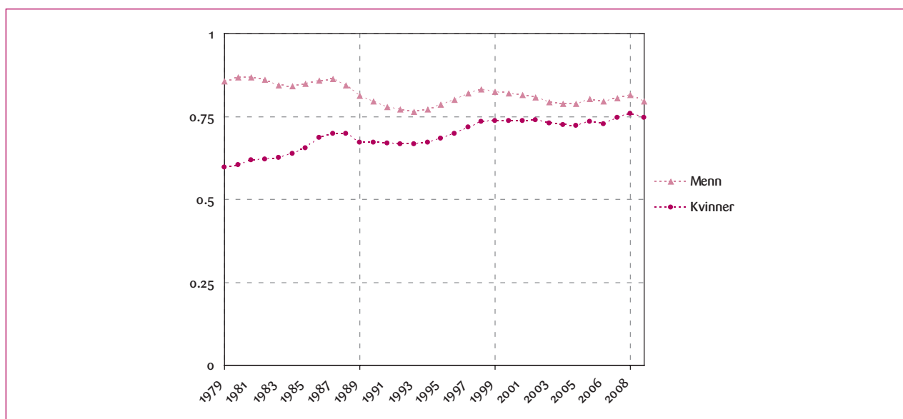
Figur 2. Sysselsatte som andel av befolkningen i yrkesaktiv alder (AKU og befolkningsstatistikk). Årsgjennomsnitt 1979–2009